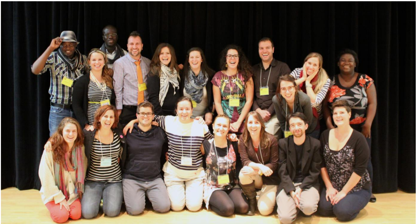
L'équipe d'animation du Sommet provincial des États généraux sur le postsecondaire en Ontario français

Du 3 au 5 octobre 2014, nous avons conclu le processus des États généraux avec un sommet provincial à Toronto, qui a permis de réunir 150 représentant.e.s de la communauté, dont 75 étudiant.e.s et élèves des quatre coins de la province. Cette dernière audience publique a précisé les souhaits exprimés par les membres de la communauté lors de la première phase du projet et a permis de ficeler les dernières recommandations qui figurent au Rapport du Sommet provincial des États généraux , publié le 10 février 2015.