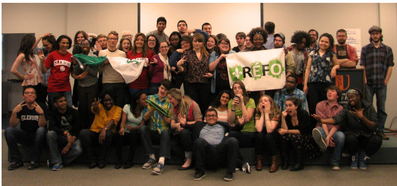
Les délégué.e.s de la 5e AGA du RÉFO à l'Université Saint-Paul

La 5 e Assemblée générale annuelle du Regroupement a eu lieu du 2 au 4 mai 2014 à l'Université Saint-Paul d'Ottawa. Au total, ce sont 60 délégué.e.s étudiant.e.s qui ont participé à l'AGA. Ils et elles provenaient de 9 des 11 institutions postsecondaires francophones et bilingues de l'Ontario. Selon nos évaluations, les participant.e.s estiment avoir une meilleure connaissance des enjeux étudiants franco-ontariens, avoir le souhait de s'impliquer pour les résoudre, avoir apprécié la chance de rencontrer des francophones de partout en Ontario et disent avoir développé une fierté renouvelée envers leur communauté suite à l'AGA.