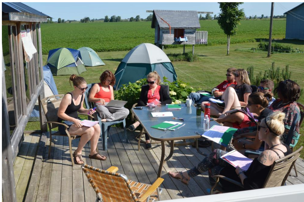
Les membres du CA en rencontre à St-Albert au mois de juillet 2014

Au début de leur mandat, les membres du CA ont participé à deux rencontres de formation qui leur ont permis d'acquérir plusieurs outils leur permettant d'assurer une saine gestion du Regroupement. Ceci a permis qu'ils et elles soient en mesure d'identifier, d'analyser et de défendre les besoins des étudiant.e.s francophones et francophiles de leurs institutions postsecondaires. Depuis leur élection en mai 2015, le Conseil d'administration a tenu huit rencontres par audioconférence et trois rencontres en personne dans la région de la capitale nationale.