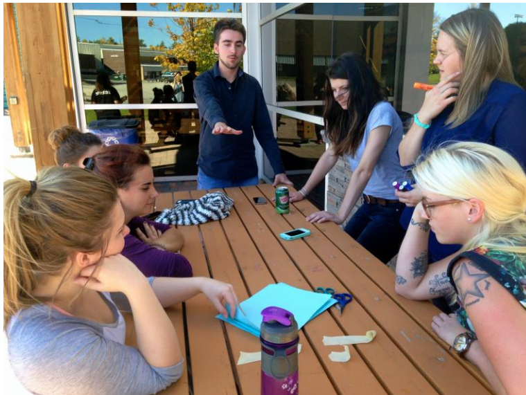
Les participant.e.s d'IMPACT ! à Timmins (septembre 2014)

À l'automne 2014, le RÉFO a tenu quatre fins de semaine d'ateliers sur l'engagement et le développement du leadership auprès d'étudiant.e.s francophones et francophiles. Ces ateliers ont eu lieu dans quatre régions de la province et ont permis de transmettre aux 40 participant.e.s une riche boîte à outils pour s'impliquer dans leur milieu de dynamiser l'espace francophone sur leurs campus. Cette première édition des ateliers a été un grand succès et les participant.e.s ont déjà organisé une série d'activités de réinvestissement local sur leurs campus, démontrant que les outils dispensés ont eu des impacts tangibles. Grâce au succès de la première édition, le RÉFO a offert deux sessions supplémentaires en janvier 2015 à une vingtaine de participant.e.s à Ottawa et Sudbury.