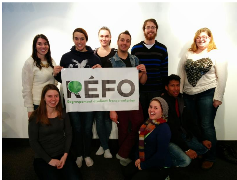
Les participant.e.s d'IMPACT ! à Sudbury (janvier 2014)