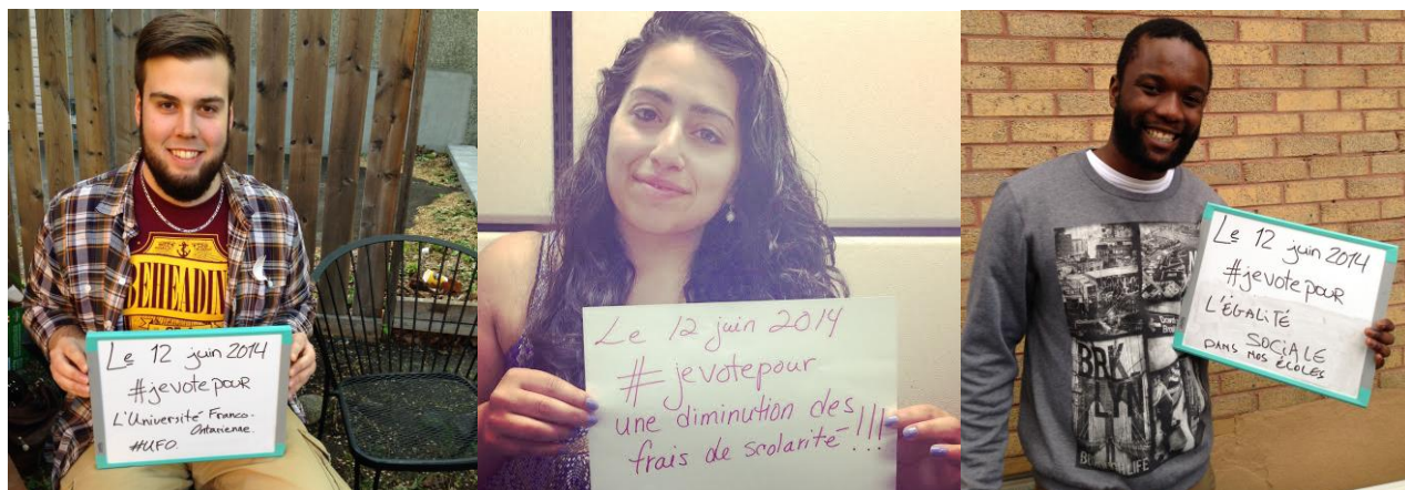
La campagne #Jevotepour dans le cadre des élections provinciales de juin 2014