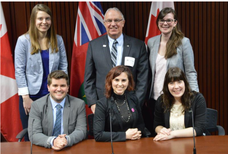
Les représentant.e.s du RÉFO, de l'AFO et de la FESFO lors de la conférence de presse tenue à Queen's Park le 12 février 2015.

Comme première étape de mise en œuvre, les trois organismes ont demandé au gouvernement de nommer, au cours de la prochaine session parlementaire, un Conseil des gouverneurs transitoire chargé d'assurer le démarrage de cette université d'ici 2018. Selon les organismes, cette nouvelle institution universitaire devra avoir un mandat d'offrir une programmation académique en français sur l'ensemble du territoire ontarien et devra d'abord entreprendre ses activités dans le Sud de la province, là où l'écart entre la population francophone et l'accès aux programmes postsecondaires en français est le plus grand. Les organismes attendent une réponse du gouvernement prochainement.