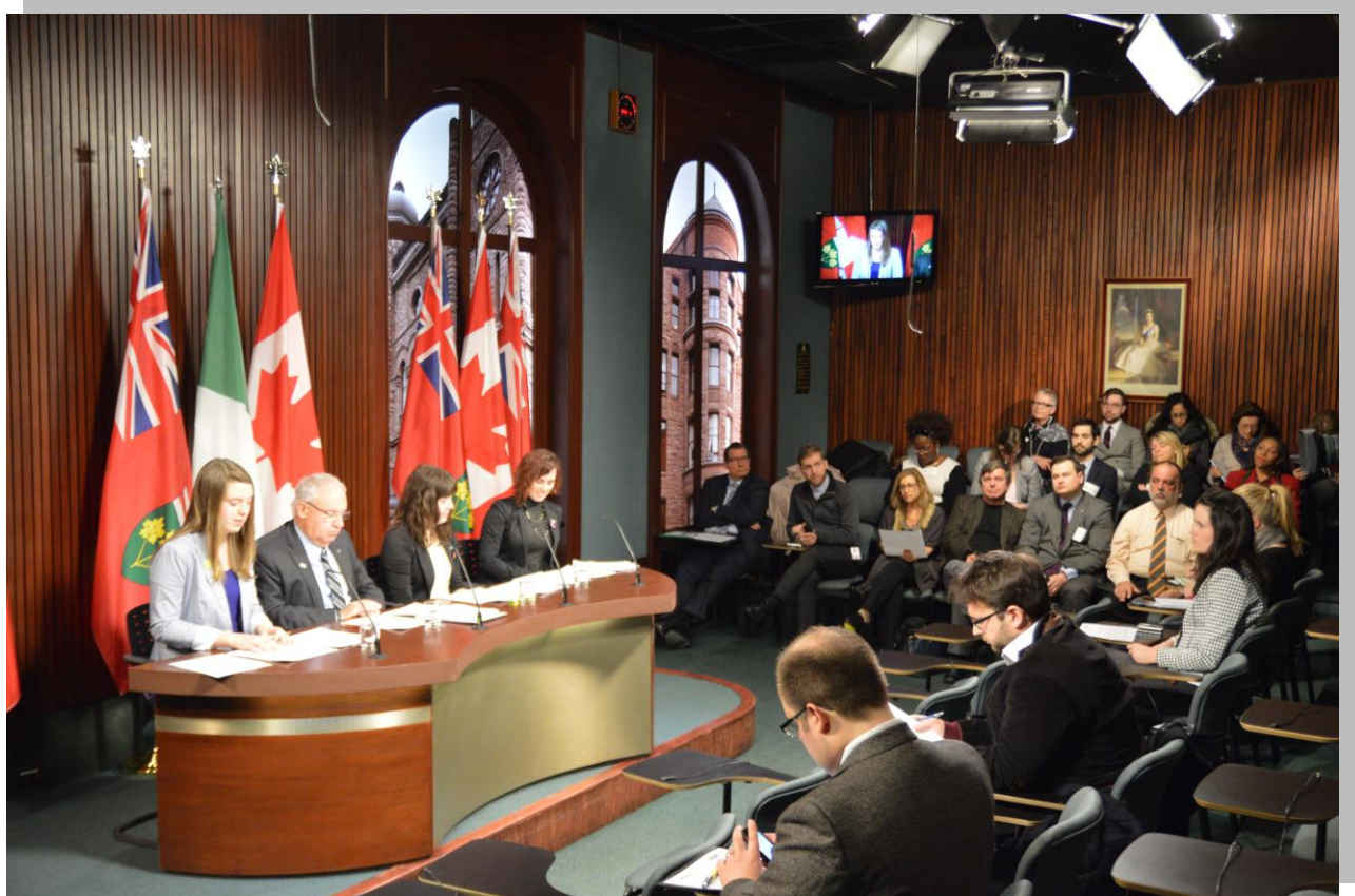
Conférence de presse du 10 février 2015 à l'Assemblée législative de l'Ontario à Toronto.