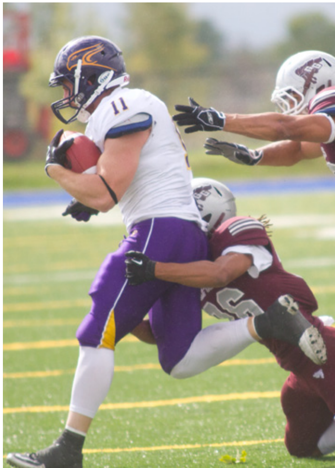
LE DOUBLE G ENCAISSE UNE QUATRIÈME DÉFAITE EN AUTANT DE MATCHS P.16