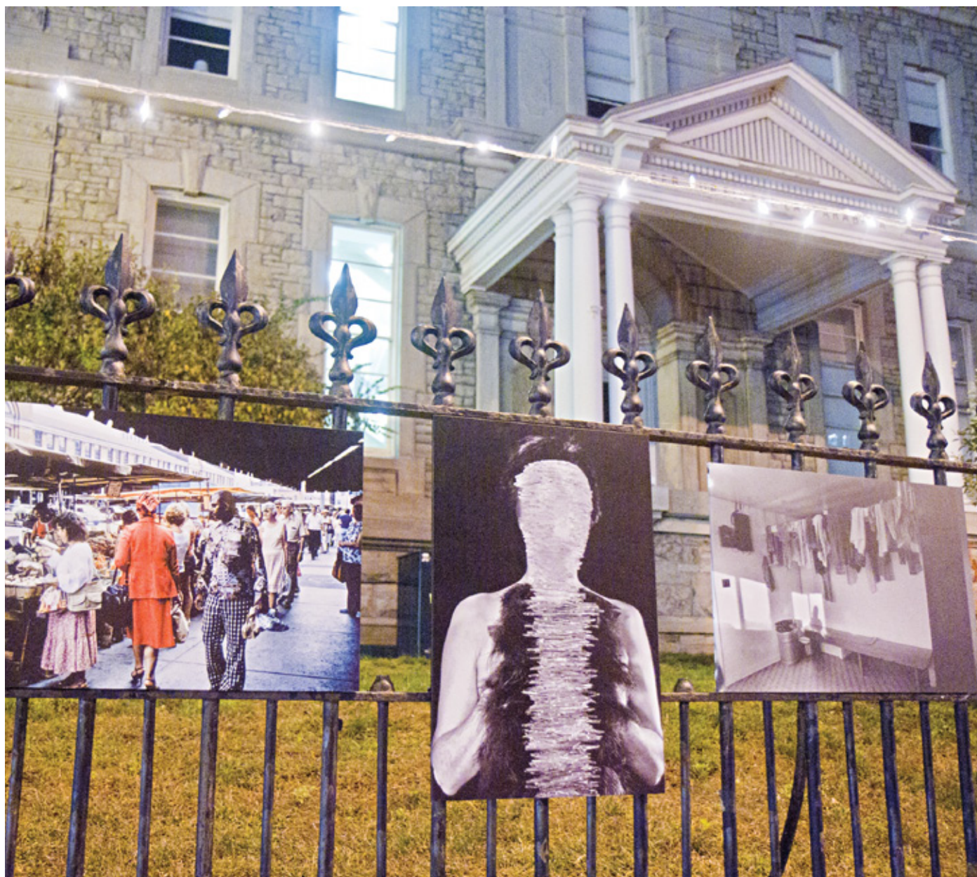
NUIT BLANCHE P. 11