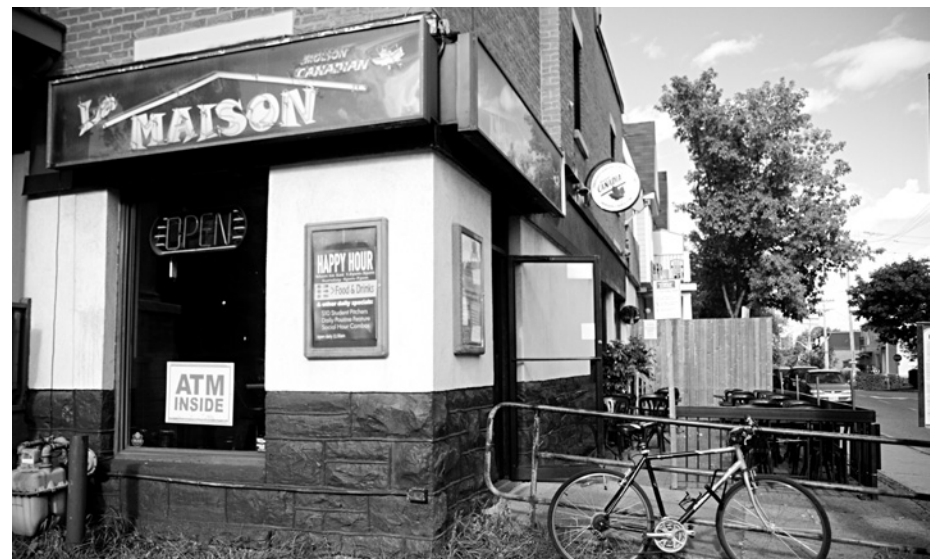
Le bar La Maison

Situé dans le Glebe, ce pub peut rappeler la ferme rurale. La vache qui nous accueille et l'atmosphère intérieure en témoignent. Tous les breuvages sont servis dans des pots Mason. Le menu a une belle variété et le hamburger au poulet et la bière maison « Barn Dog Ale » sont fortement recommandés.