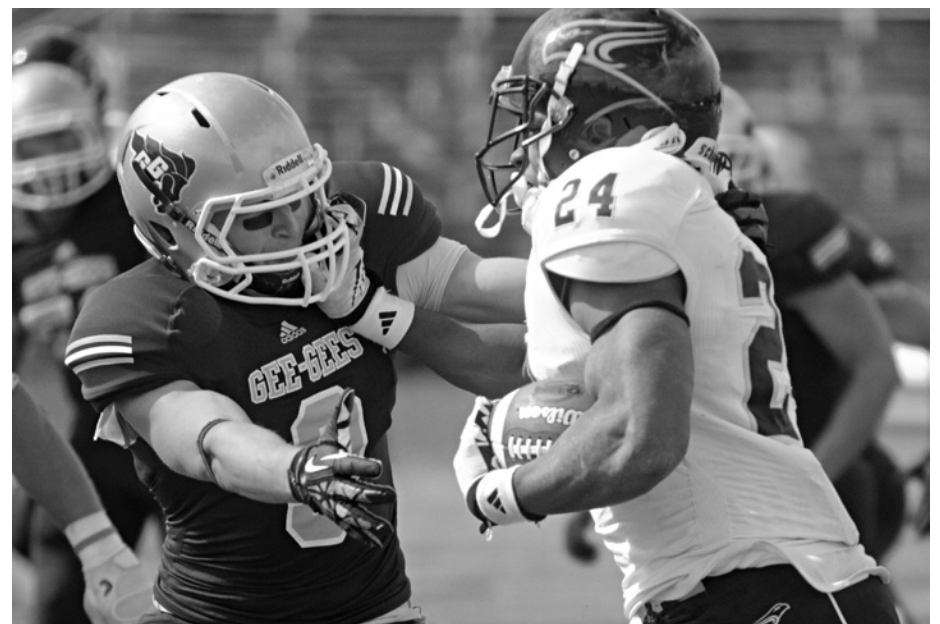
Les Gee-Gees ont capitulé devant les Golden Hawks

Le jeu est resté intense et très serré jusqu'à ce qu'une surprise de Laurier, assurée par le botteur Ronald Pfeffer épaulé de Josh Pirie, ne vienne solder le troisième quart par une égalité de 25-25, et ce, malgré les efforts inlassables fournis par les Gee-Gees.