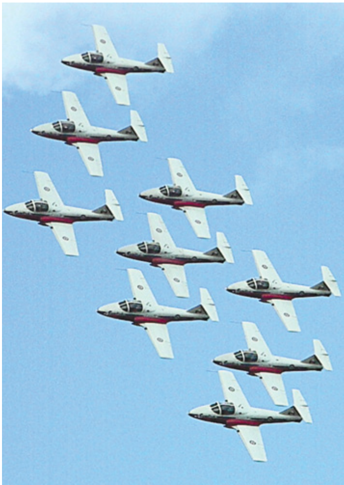
SPECTACLE AÉRIEN À GATINEAU P.12